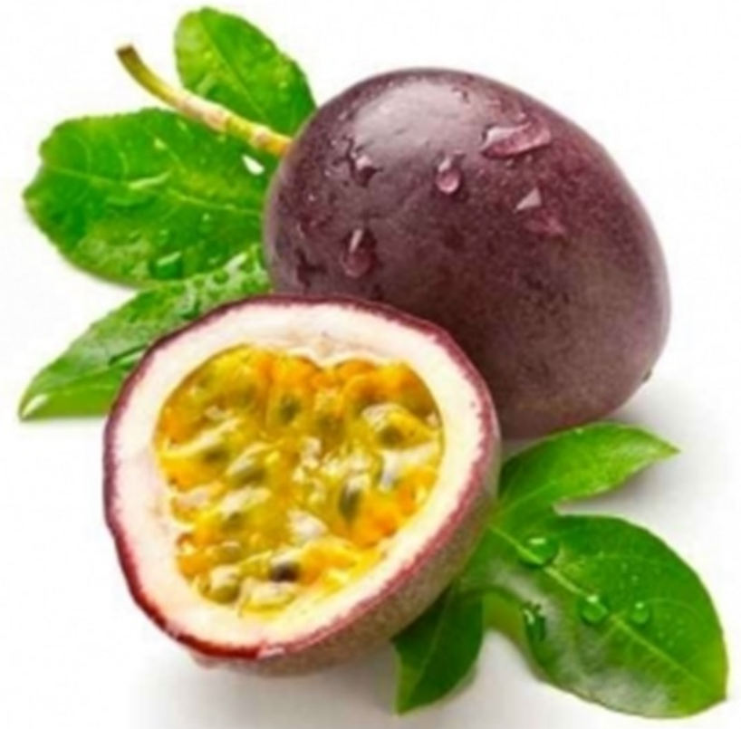
FRUIT DE LA PASSION