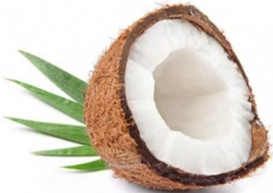
NOIX DE COCO