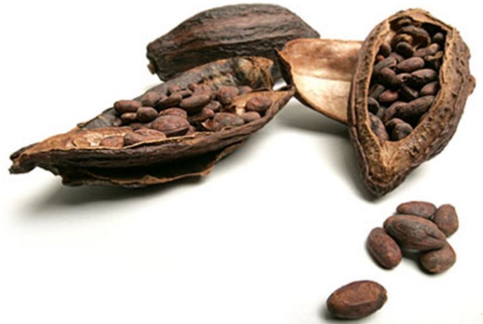
FEVE DE CACAO